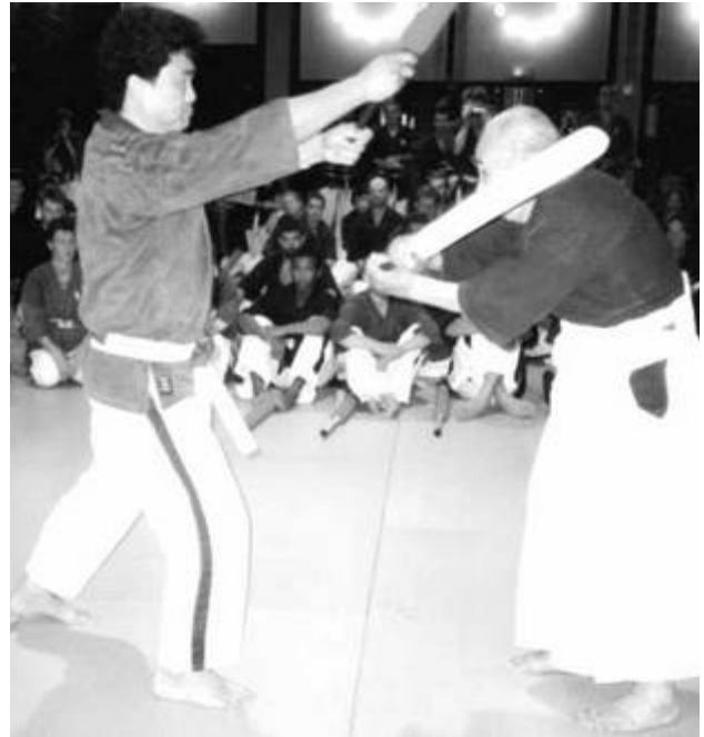
Minoru Mochizuki, en 2000, lors d'une petite démonstration.

C'est une base qui évidemment a été développée de différente manière mais qui reste fondamentalement la même. L'aïkido s'intègre tout autant dans ce système que, par exemple, le karaté