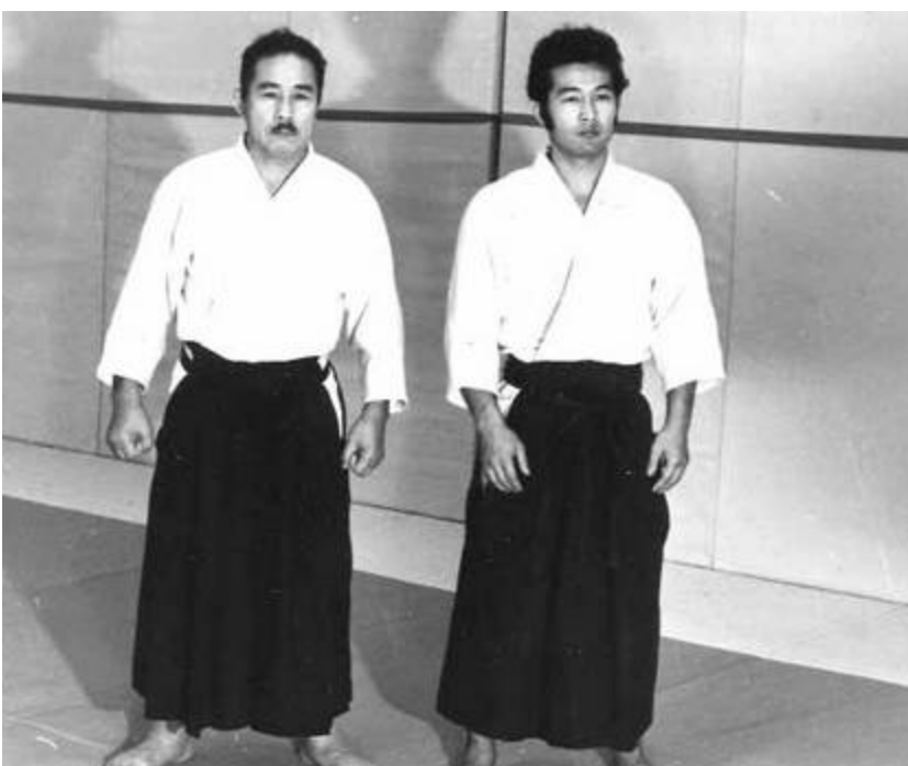
Mochizuki père et fils en 1971.

Nous avons organisé des stages internationaux en France, et à partir de là nous avons établi un système de stages dans différents pays. C'était le début. Ces karatékas de la première génération sont un peu horrifiés et ils disent des choses négatives sur moi.